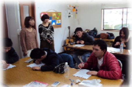
英語講座の一場面

新しい講座の時間割は、新学期に発表します。来年度の講座もお楽しみに。是非いろいろな講座に積極的に参加してみてください。